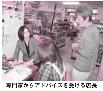
専門家からアドバイスを受ける店長