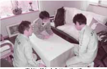
真剣に話し合うリーダー達

感想 ワーキング(全員参加型)の形で、リーダー同士が話し合う事で仕組み作りを通して、自分達に足りないものに気づけた事が大きい。また、社外の専門家の話を聞く事で、普段得られない刺激をもらいモチベーションが上がった事も嬉しい限り。