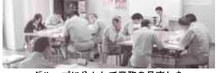
グループに分かれて業務の見直しを